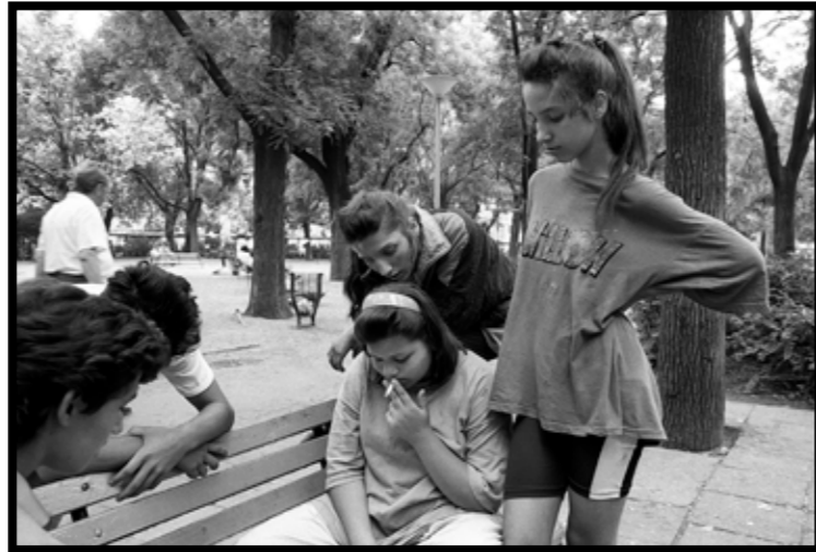
De foto's in dit MAGGEZIEN zijn gemaakt in de jaren 1983 t/m 1991. Het zijn allemaal analoge opnamen en in 2011 gescand en gedigitaliseerd.